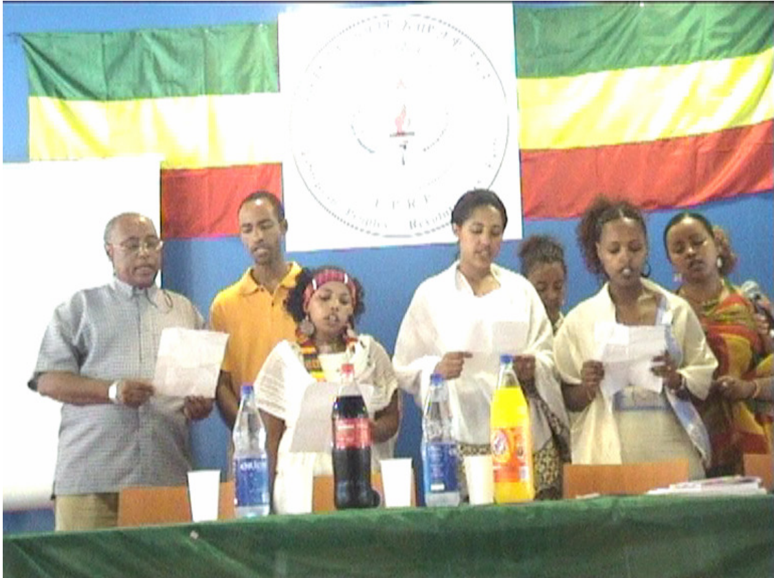
መብቴን ላስከብር ጨቋኝን ልሽር ተነሽቻለሁ ዛሬ...

በማለት የኢሕአፓን መሪ መዝሙር «ለትግሉ ነው ሕይወቴ»ን ሲዘምሩ ላዳመጠ እና ላስተዋለ፣ ምንም እንኩዋን በኢሕአፓ ላይ ፋሽስቶች ያደረሱት ጭፍጨፋ እያንዳንዱን ቤት ያንኩዋኩዋ፣ ዕልፍ አዕላፍትን የመተረ ቢሆንም፣ ሰማዕታቱ የወደቁለትን ክቡር ዓላማ ወራሽ እንዳላሳጣው መዘምራኑ እራሳቸው ምስክር ይሆኑታል። የሚበዛው ታዳሚ ወጣት መሆኑን ላስተዋለም ይከው ነው የሚታየው።