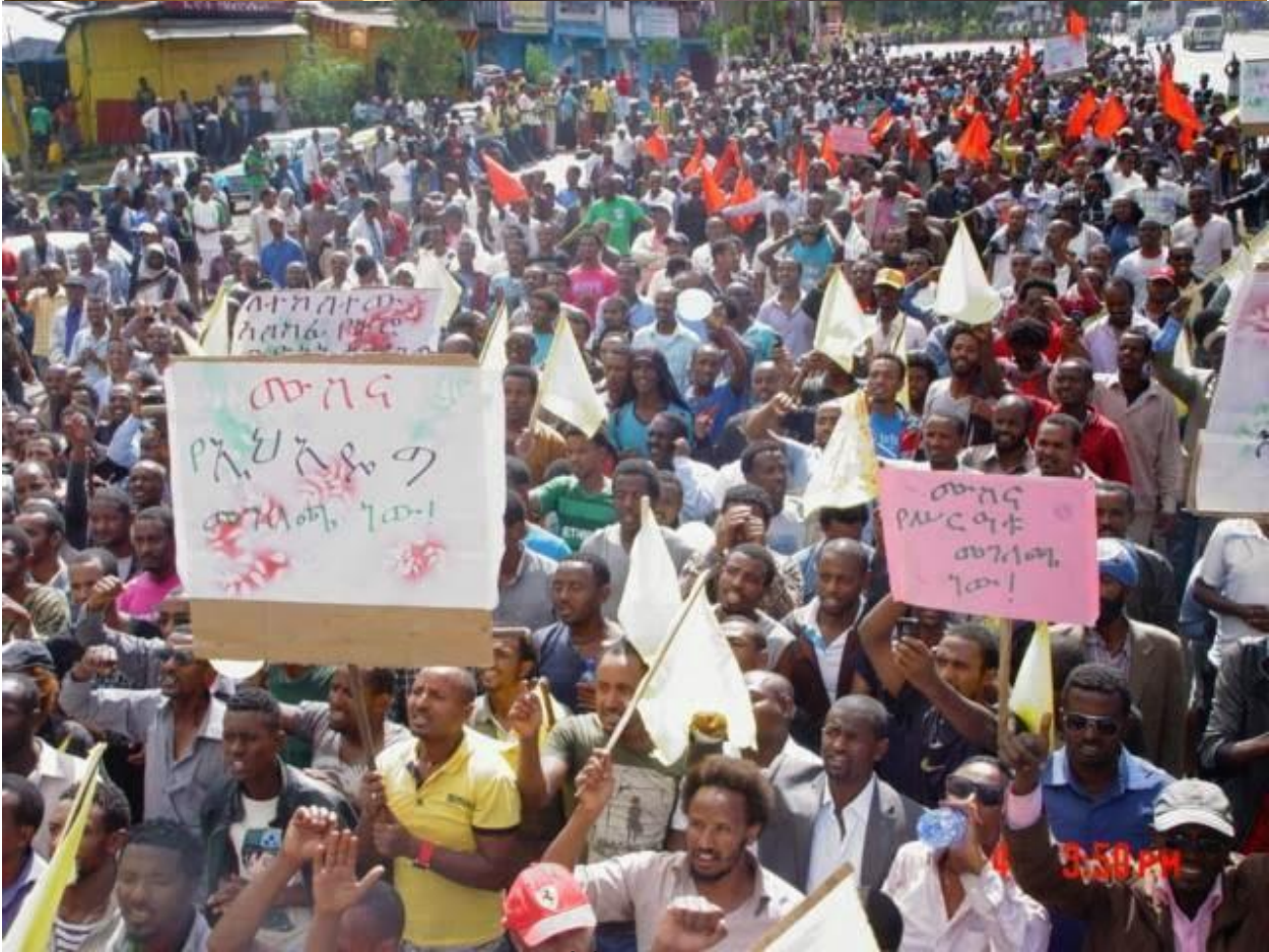
አሁን ደግሞ ወደ ሳማያዊ ፓርቲ እታቸ ያለውን ጉድ እንመልከት