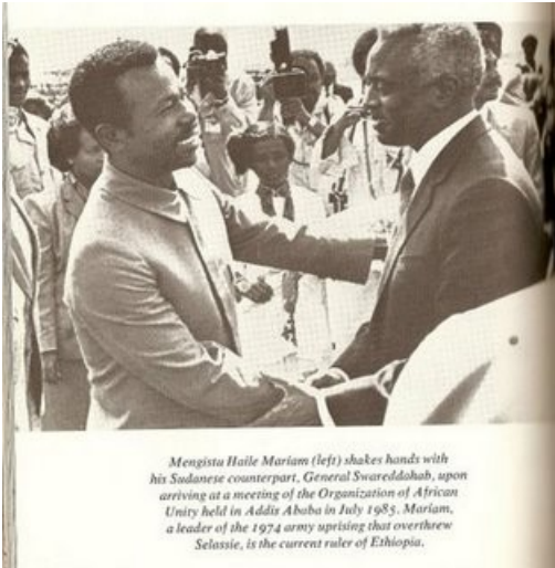
Mengistu Haile Mariam (left) shakes hands with his Sudanese counterpart, General Swareddahab, upon arriving at a meeting of the Organization of African Unity held in Addis Ababa in July 1985. Mariam, a leader of the 1974 army uprising that overthrew Selassie, is the current ruler of Ethiopia.