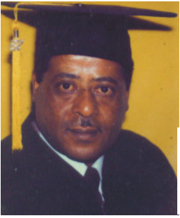
የወንድም ወልደአማኑኤል አጭር የሕይወት ታሪክ