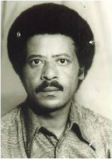
ወልደሺ ተኪ ኢትዮጵያ